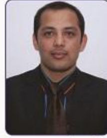
जगतजंग जि.सी. संचालक